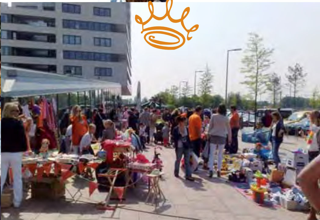
Boulevard Nesselande nodigt alle wijkbewoners uit om Koninginnedag te vieren bij het winkelcentrum.