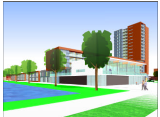
Kindercluster I Brede School Nesselande

In Nesselande wordt gestart met de realisatie van het eerste gebouw van de Brede School Nesselande. Hier zullen voorzieningen voor basisonderwijs, kinderopvang, seniorenhuisvesting, sociaal cultureel werk en schooltuinen bij elkaar komen. Het idee voor deze invulling van de brede school komt uit Zweden. Daar is gebleken dat het samenvoegen van voorzieningen elkaar versterkt en een absolute meerwaarde heeft voor jong en oud!